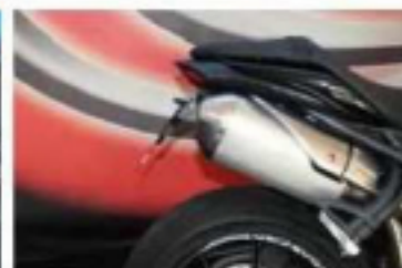
EVOTECH TAIL TIDY